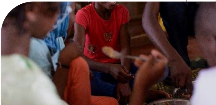
Les élèves prenant leur repas dans l'apartame nouvellement construit

Mené au Sénégal par le Conseil national de concertation et de coopération des ruraux (CNCCR), ce projet vise à approvisionner 15 écoles primaires en produits locaux de qualité dans 3 départements, tout en sensibilisant la population aux enjeux du consommer local, notamment à travers le festival ALIMENTERRE.